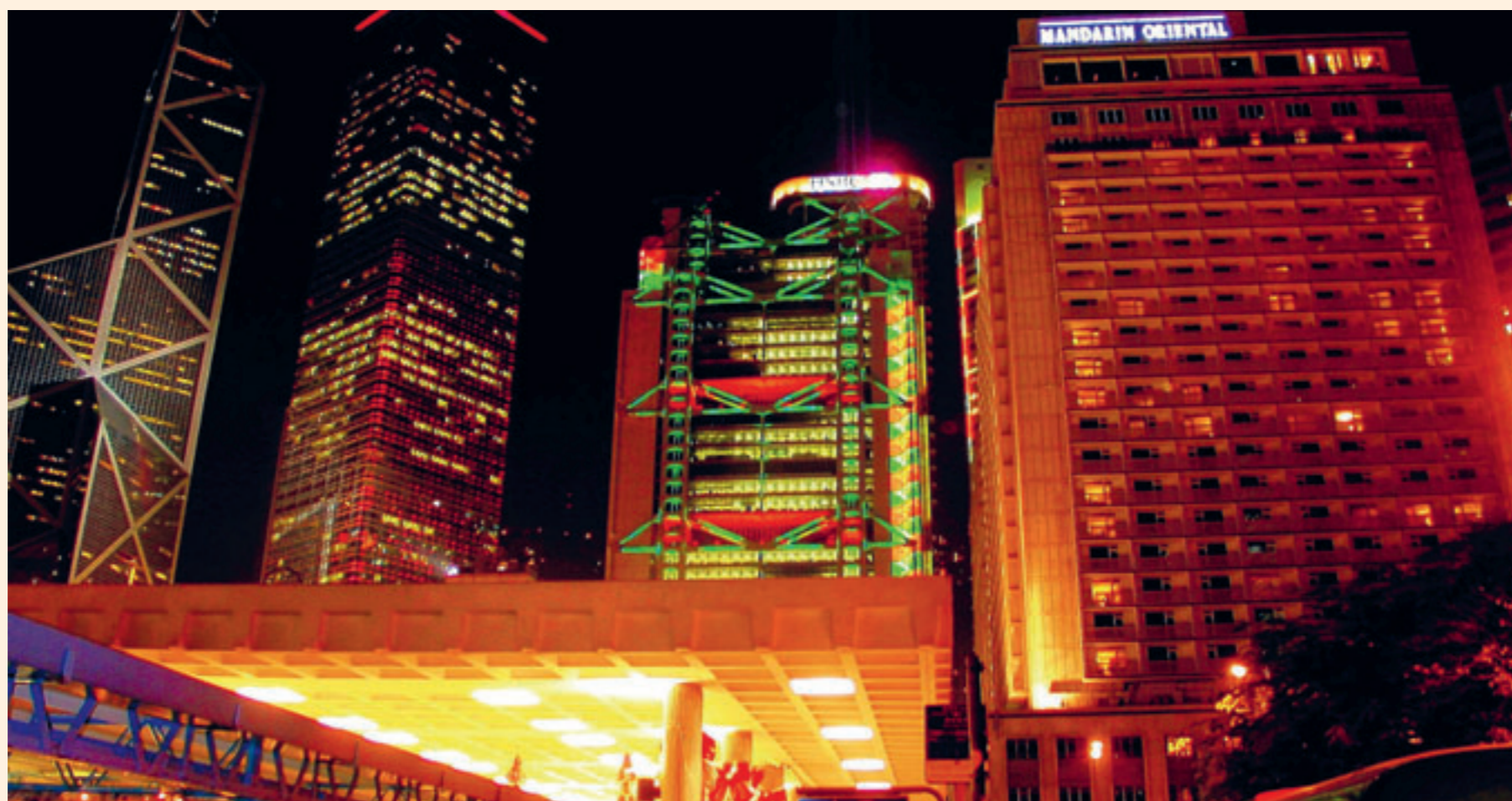
Het Mandarin Oriental Hotel in Hongkong is eigendom van Jardine Strategic. Die holding uit Singapore is een van de favoriete aandelen van de Gentse vermogensbeheerder Value Square.

In de top tien staan drie Golfstaten en vier Aziatische landen. Hun hoge scores zijn vooral te danken aan de geringe schuldgraad, de goede begrotingstoestand en de grote handelsoverschotten (voor de Golfstaten te danken aan de olie en gas), de hoge spaarquote en stevige economische groei. Noorwegen (9) is het enige Europese land in de top tien. Het Scandinavische land dankt die positie aan de torenhoge inkomsten uit de verkoop van olie en gas en de gunstige im-