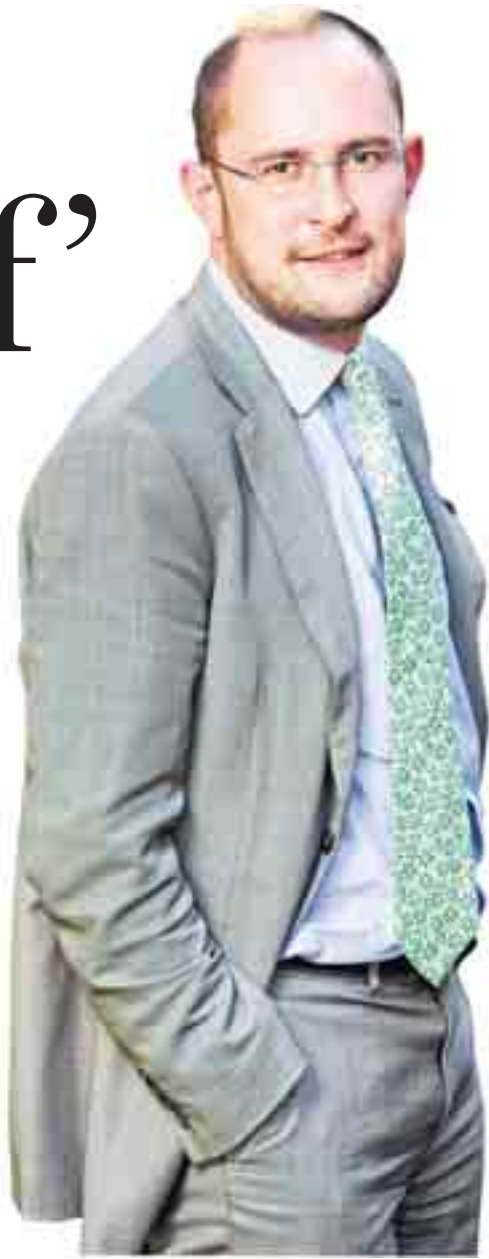
Vincent Van Quickenborne.

aan pensioensparen en dat al sinds mijn twintigste. Ik zal niet eeuwig aan politiek blijven doen, vermoedelijk kies ik na de politiek nog voor een carrière in het bedrijfsleven. Na de verkiezingsnederlaag ben ik al gepolst om een bedrijf te helpen opstarten, maar nu is de goesting te groot om voort te toen met de partij en de politiek.'