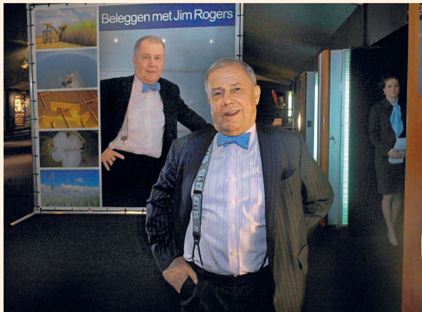
Jim Rogers: 'In de Filipijnen hebben ze geprobeerd de voedselprijzen kunstmatig aan banden te leggen. De boeren wilden hun land niet meer op.'

Nochtans is de strategie van de kleine, buikige Rogers onderhand genoegzaam bekend: 'Koop grondstoffen!' Dat advies diste hij andermaal op. En of de wereld nu op een nieuwe periode van hoogconjunctuur afstevent, of weer in een lichte recessie verzeilt, grondstoffenprijzen blijven stijgen, houdt Rogers vol. 'In het eerste scenario worden ze gestuwd door de combinatie van stijgende vraag en een te lage productiecapaciteit. In het tweede geval door de acties van de centrale bankiers. Zij zullen blij-