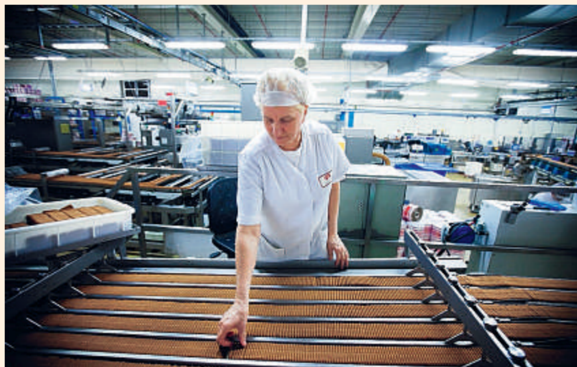
Lotus Bakeries heeft nog langetermijnbeleggers. Een Lotus-aandeel blijft gemiddeld 14,5 jaar in portefeuille.