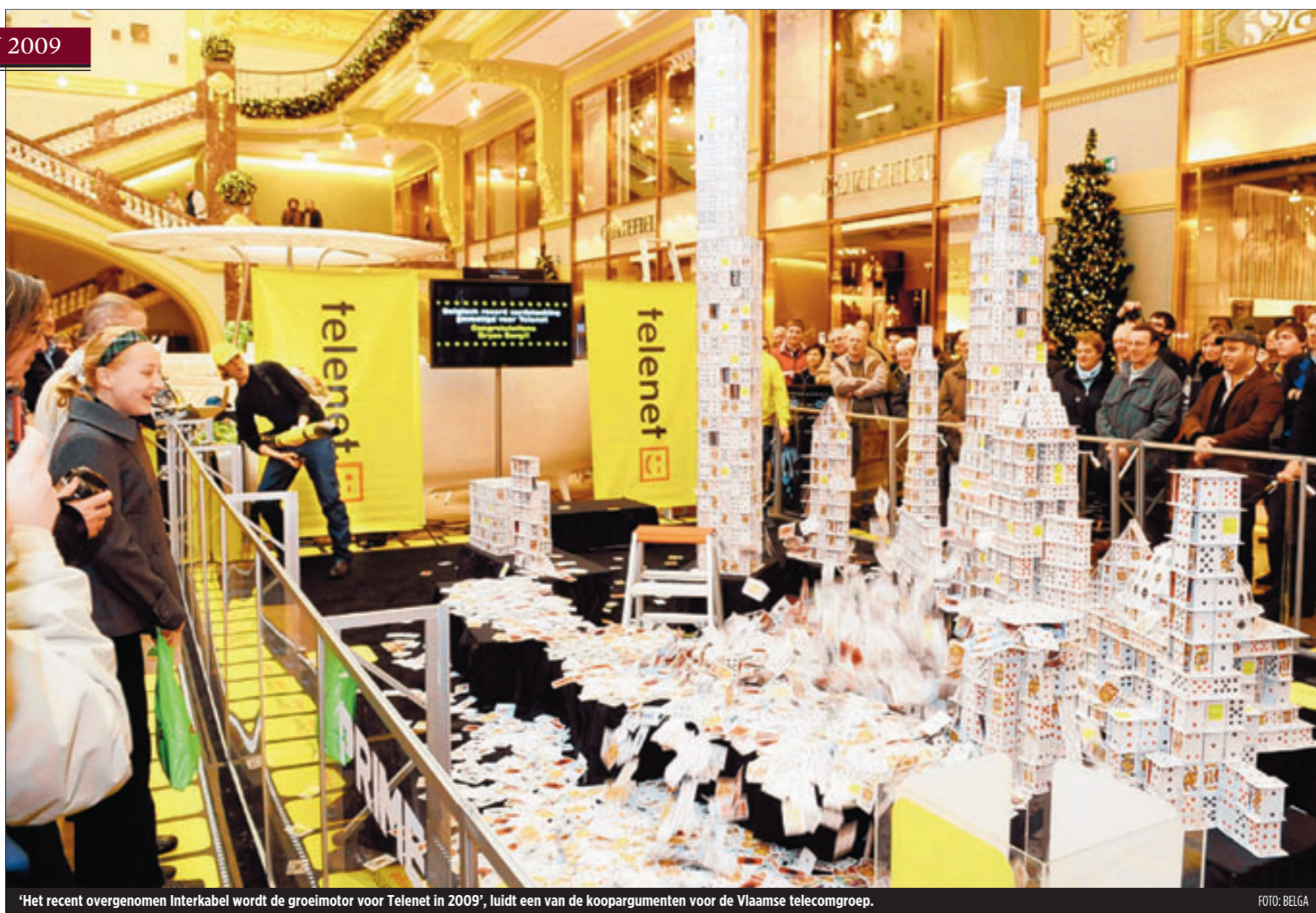
'Het recent overgenomen Interkabel wordt de groeimotor voor Telenet in 2009', luidt een van de koopargumenten voor de Vlaamse telecomgroep.

De buitenlandse top tien leest u op pagina 24, eerst de Belgische top picks.