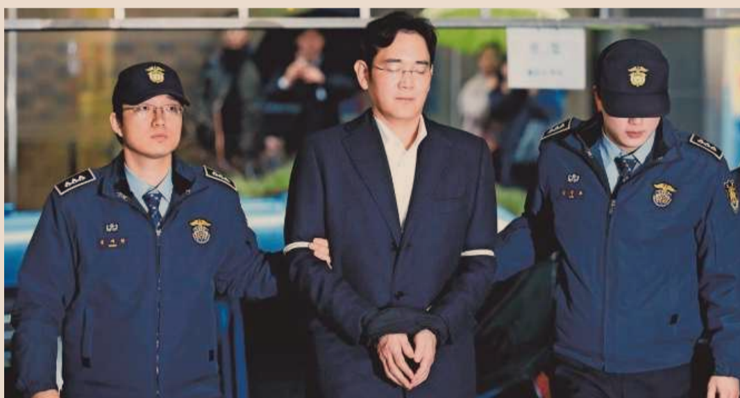
Na de arrestatie van topman Lee Jae-yong besliste het bestuur van Samsung Electronics de stichtende familie minder macht te geven.

'Naast het gunstige macroplaatje verbetert ook de micro-omgeving', gaat Richdale verder. 'De bedrijven in de groeilanden hebben hun schulden teruggebracht. Het aantal wanbetalingen op bedrijfsobligaties is gezakt naar het laagste peil in zes jaar. Sinds begin vorig jaar stijgt ook de winst per aandeel weer. De bedrijven profiteren van deflatie: een geleidelijke stijging van de prijzen, zonder overdrijving. Vooral in China leidt dat tot opluchting. De producentenprijzen daalden er sinds 2012 tot 2016 onafgebroken. Als je de prijzen voor je